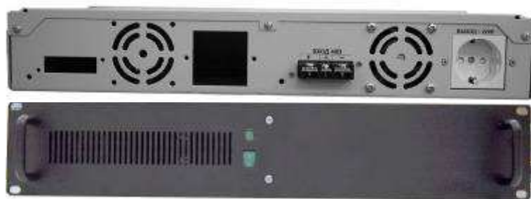
Исполнение 1 (19" модуль высотой 2U)

4.2 Конструктивно ИЗДЕЛИЕ выполнено в двух исполнениях (см. рисунок 1 и строки 14 и 15 таб. 1).